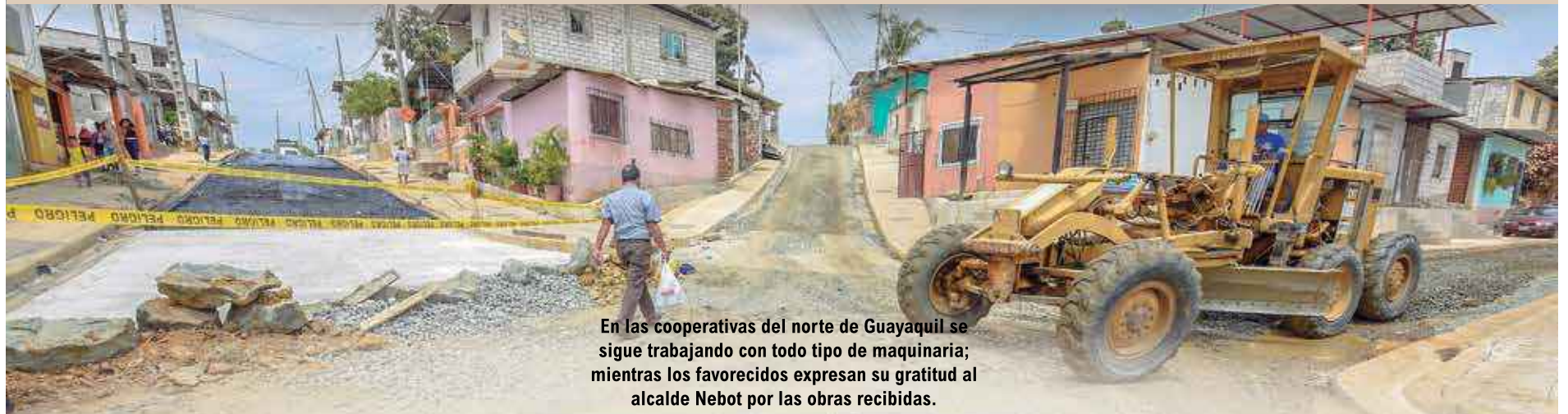
En las cooperativas del norte de Guayaquil se sigue trabajando con todo tipo de maquinaria; mientras los favorecidos expresan su gratitud al alcalde Nebot por las obras recibidas.

La Alcaldía de Guayaquil no detiene sus trabajos de mejoramiento vial y con ello producir significativas mejoras en la calidad y condiciones de vida de sus habitantes. Entre las labores que se realizan están, por ejemplo, las de pavimentación, construcción y reconstrucción de aceras, bordillo y cunetas, actualmente en la cooperativa Lomas de la Florida, al noroeste de la Perimetral. Allí, donde ya se ha instalado el sistema de alcantarillado sanitario, se están adecentando sus calles para beneficiar a unas 50.000 personas.