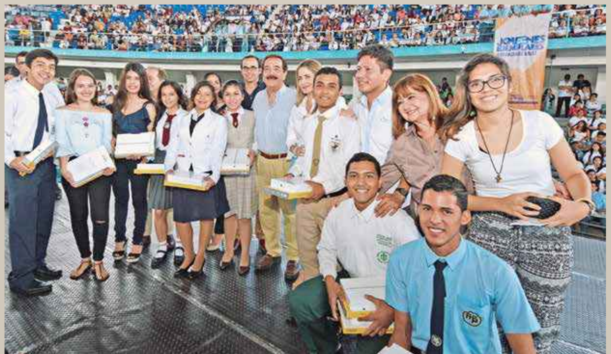
Los recientemente graduados bachilleres de las escuelas fiscales y fiscomisionales deben inscribirse para recibir gratuitamente las tabletas que da el Municipio.

guir los siguientes pasos: crear una cuenta personal, llenar el formulario con los datos solicitados, enviar y esperar un e-mail de confirmación, para activar la cuenta. Si una vez realizado el registro no se ha recibido el e-mail de confirmación, el bachiller debe volver ingresar a la página y solicitar una nueva contraseña