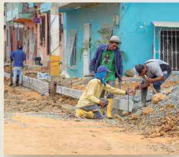
La construcción de bordillos, aceras y cunetas se complementan con las obras de pavimentación que se realizan.