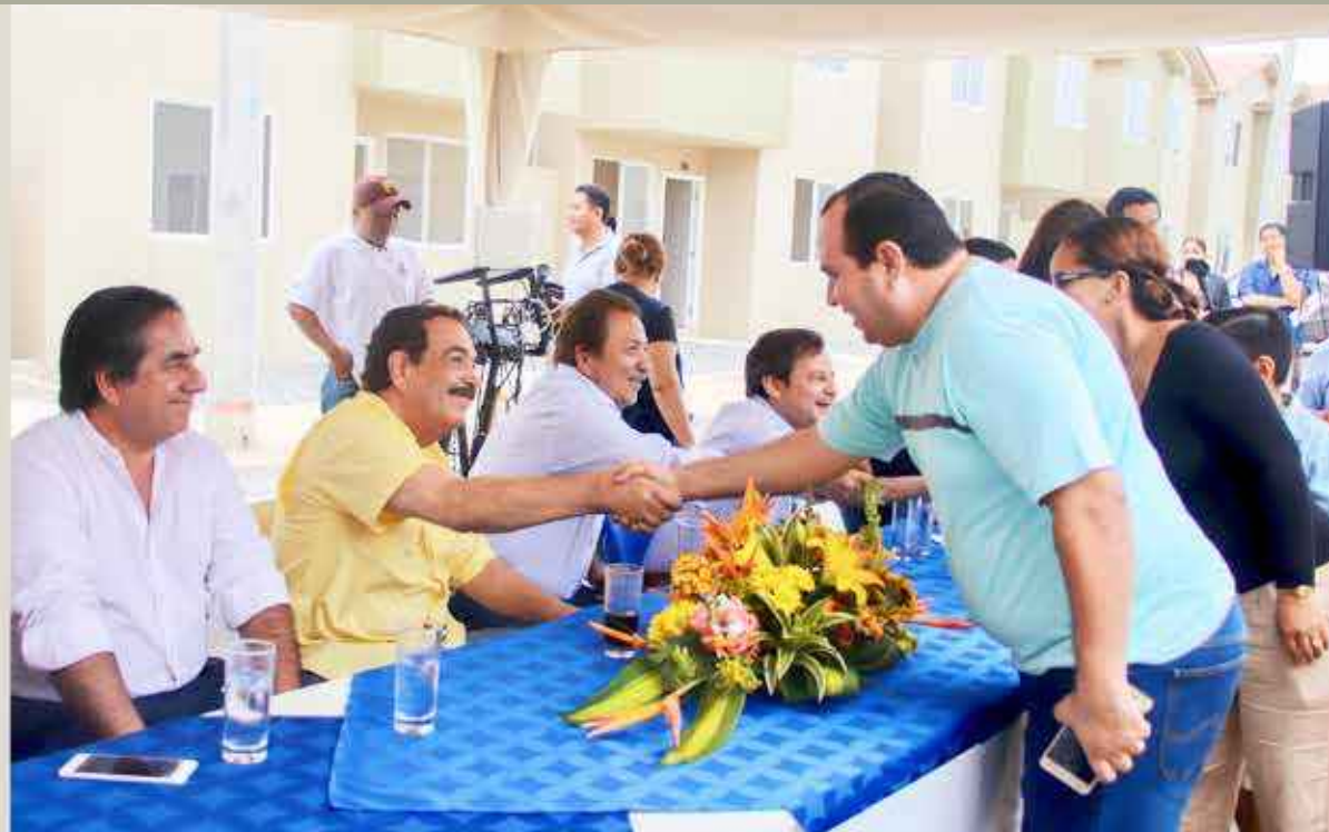
El alcalde Nebot no oculta su satisfacción al entregar personalmente las casas de Villa Bonita a los nuevos y felices propietarios.

Además, el primer personero anunció que tal como se había comprometido para ofrecer seguridad a las personas que allí habitan ya se encuentra lista la Unidad de Policía Comunitaria (UPC), para cuyo efecto su administración donó el terreno y la promotora inmobiliaria lo construyó y equipó. Tras las gestiones respectivas con la Gobernación, miembros de la Policía Nacional brindarán sus servicios a los vecinos.