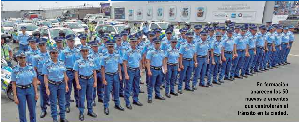
En formación aparecen los 50 nuevos elementos que controlarán el tránsito en la ciudad.

L a transportación en Guayaquil se la puede dividir en un antes y un después. Desde que la alcaldía de Jaime Nebot asumió la delicada competencia sobre esta temática, a través de la Autoridad de Tránsito Municipal (ATM), se ha venido trabajando incansablemente sin dejar de