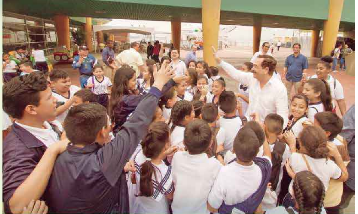
El alcalde Jaime Nebot recibe el afectuoso saludo de algunos estudiantes antes de la inauguración de este programa educativo que será gratuito y muy valioso para los niños guayaquileños.

Finalmente, el alcalde Nebot motivó a los estudiantes. "¡Ustedes son el hoy de Guayaquil y del Ecuador! Hoy es que tenemos que atenderlos, edu-