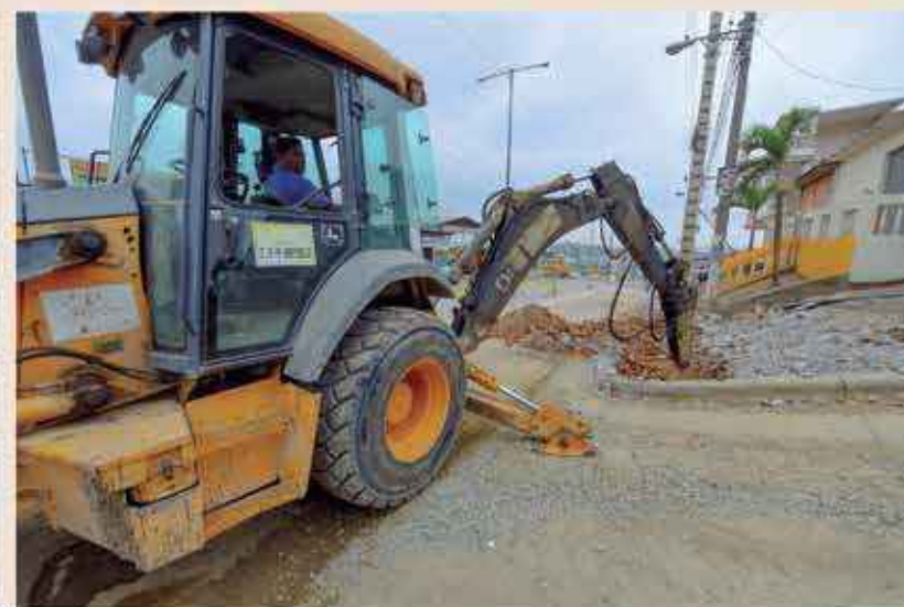
Los trabajos para proveer alcantarillado y también agua a todos los moradores de Guayaquil no se detienen jamás.