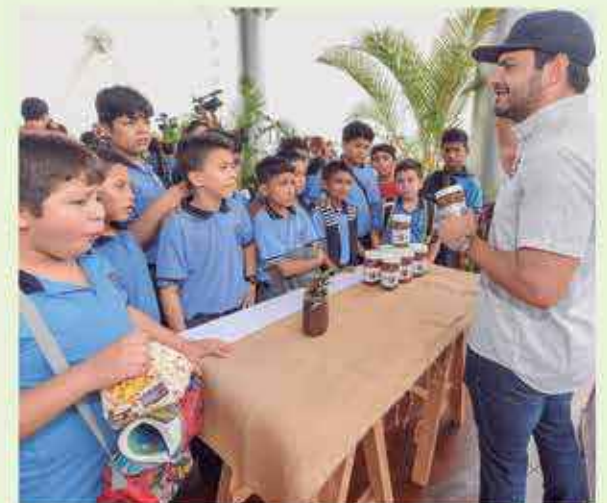
Niños ávidos de conocimientos conocen las nuevas técnicas de reciclaje y así, ellos, pueden colaborar con el cuidado ambiental.