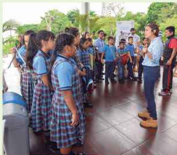
Los estudiantes aprenderán este año acerca de medio ambiente, cómo reciclar y sobre toda la historia de Guayaquil.

mentales enfocados a temas de desarrollo sostenible como Amazonas, Kaluoka'Hina El Arrecife Encantado, Creando nuestro mundo y Revolución. Adicionalmente, se ofrecerán charlas sobre contaminación acústica, así como los encuentros llamados 'Tardes Verdes', iniciativa que consiste en conversaciones 'after office', lideradas por iniciativas locales que serán abiertas al público que esté interesado en causas amigables con el ambiente.