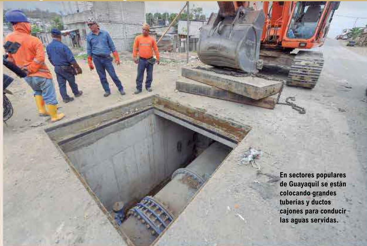
En sectores populares de Guayaquil se están colocando grandes tuberías y ductos cajones para conducir las aguas servidas.

Hay que indicar, además, que la mayoría de las cooperativas de vivienda que están al pie de la Perimetral, ya han sido servidas con la dotación de agua potable, lo mismo que con los sistemas de alcantarillado pluvial y sanitario, y los contratistas cumplen sus tareas dentro de los cronogramas y plazos establecidos. Cabe indicar que la admi-