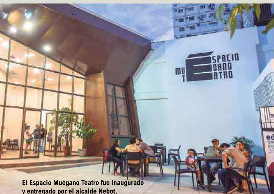
El Espacio Muégano Teatro fue inaugurado y entregado por el alcalde Nebot.

Por otra parte, se avanza con los trabajos de regeneración urbana de la calle A, desde la iglesia del Cristo del Consuelo en Lizardo García hasta el Puente de la A, lo que conectará a los feligreses con el monumento que se levanta en Cisne 2. De esta forma los obreros mejoran el entorno con nuevos bordillos, veredas y la refacción completa de las aceras. También se rehabilita los sistemas de alcantarillado sanitario y de aguas lluvias, y de agua potable. Cabe indicar que se terminan de arreglar las fachadas de las casas, colocar nueva iluminación e instalar mobiliario urbano como tachos de basura y otros para cambiar la imagen de ese sector de la urbe porteña. Igualmente se trabaja en el parterre central de la avenida Carlos Luis Plaza Dañín, en el tramo comprendido entre la avenida de las Américas y Pedro Menéndez Gilbert.