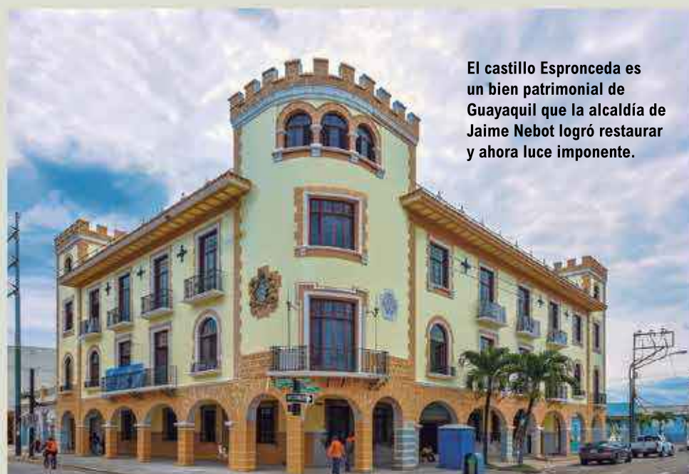
El castillo Espronceda es un bien patrimonial de Guayaquil que la alcaldía de Jaime Nebot logró restaurar y ahora luce imponente.