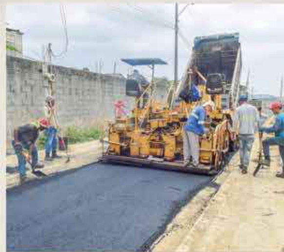
La pavimentación llega a las calles y avenidas de la urbe. Miles de cuadras lucen su nuevo aspecto.

Nuevos trabajos de bacheo y reposición de carpeta asfáltica entregó recientemente la Alcaldía. Se trata de la obra realizada a lo largo de la calle 39, desde Vacas Galindo hasta la B, en el Suburbio Oeste de la ciudad. Las obras ejecutadas abarcan siete calles, unos 3,7 kilómetros, que hoy lucen totalmente mejoradas y expeditas al tránsito vehicular y peatonal. Una segunda etapa se hará próximamente y la misma incluye siete nuevos sectores con trabajos de pavimentación y repavimentación de sus vías.