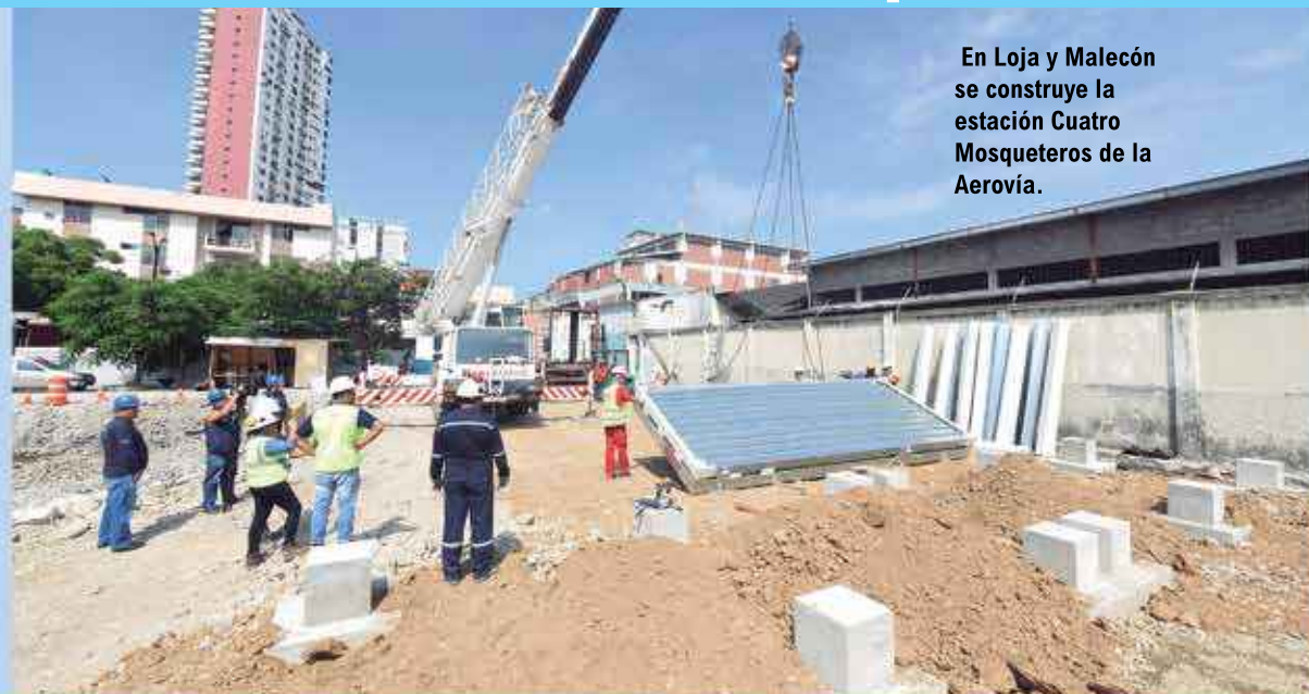
En Loja y Malecón se construye la estación Cuatro Mosqueteros de la Aerovía.

El proyecto Aerovía está en plena ejecución y se trabaja en los lugares donde, de acuerdo al estudio técnico, serán instaladas las estaciones: Malecón y Loja; una estación técnica; en las inmediaciones del cementerio general; y, en la Av. Quito y Julián Coronel. La estación de origen está ubicada en el