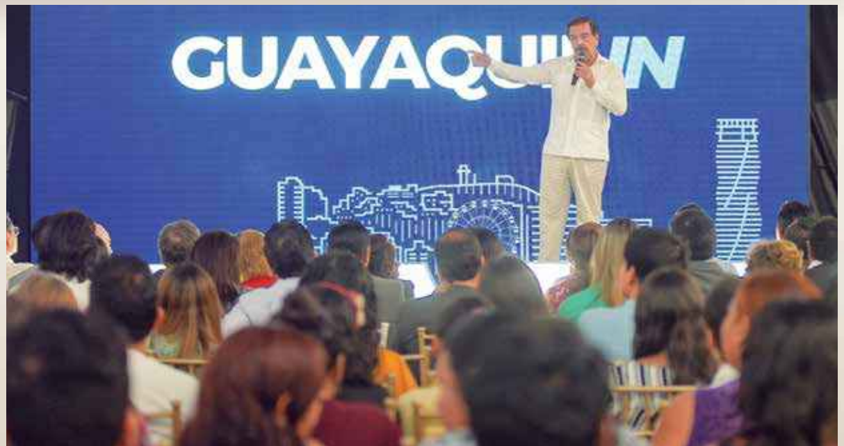
El alcalde Jaime Nebot explica que con este programa los niños tendrán acceso a nuevas tecnologías. Este beneficio también lo recibirán sus padres, además de los maestros y miembros de la comunidad.

Por otra parte, la Alcaldía de Guayaquil, como en años anteriores, dentro de su programa institucional Bachiller Digital, entregará más de 26.000 tabletas a igual número de bachilleres del periodo 2017-2018, por lo cual se abrieron las respectivas inscripciones. Para cumplir con este requisito los bachilleres deben acceder a la página web bachillerdigital.com