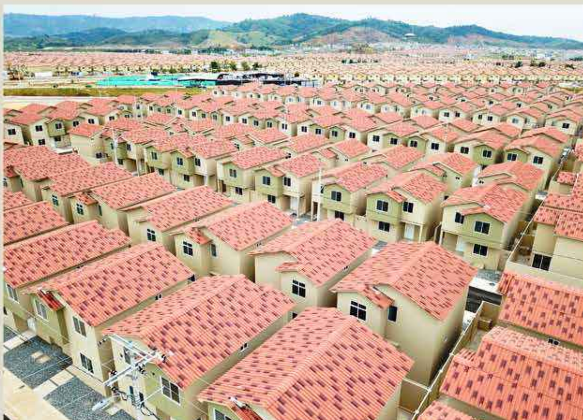
El Municipio de Guayaquil lleva adelante la iniciativa de proveer viviendas a las familias y esta gestión cuenta con el apoyo de la empresa privada y la banca.