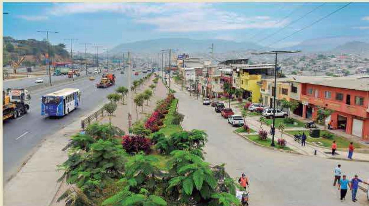
Las arterias que bordean el parque Multipropósito El Fortín, con pavimento, aceras y bordillos, lucen hermosas. La obra del Municipio llegan a todos los sectores de la ciudad.

Al referirse al servicio que ofrecen las mototaxis en el sector, el Alcalde dijo que son un ejemplo de transformación considerando que ahora cuentan con unidades nuevas y, sobre todo, están