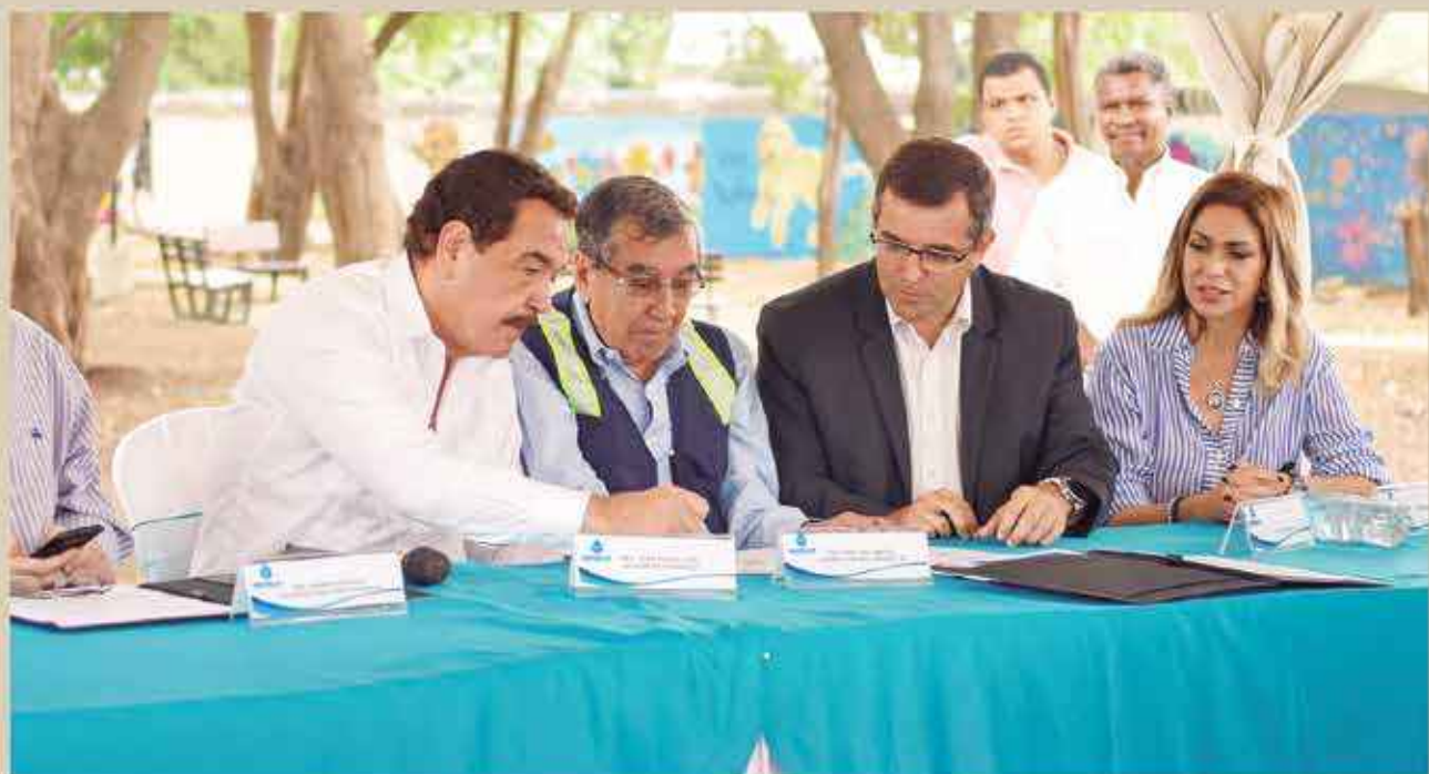
El jefe del Cabildo, Jaime Nebot Saadi rubrica como Testigo de Honor el contrato para la construcción de la línea de impulsión tunelizada en el sector de La Pradera, al sur de la ciudad.