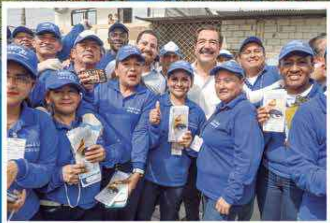
A diario, el Alcalde de Guayaquil recibe el afecto de quienes moran en Guayaquil y éstos no pierden la oportunidad de retratarse con el jefe del Cabildo.

Las nuevas instalaciones del hospital municipal del Día Ángel Felicísimo Rojas, ubicado en el km. 11,5 de la vía a Daule, al norte de la ciudad, fueron entregadas totalmente remodeladas. Los trabajos se ejecutaron para atender mejor a los ciudadanos, ofreciéndoles servicios dignos y de calidad, reafirmando que la salud es una prioridad, porque el único objetivo es servir y servir bien a la población más vulnerable.