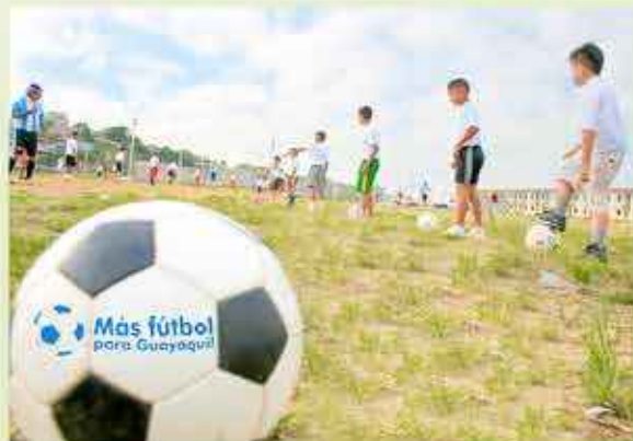
Los niños se inscriben entusiasmados porque pueden jugar y aprender más de fútbol y esta facilidad la reciben gratuitamente del Municipio.

Los planes municipales en materia deportiva se cumplen a plenitud y un claro ejemplo de ello son las escuelas de fútbol que son los espacios para que niños y jóvenes, particularmente aquellos con menores recursos económicos, tengan la oportunidad de probar y mostrar sus habilidades. Tanto la inscripción como el aprendizaje es gratuito,