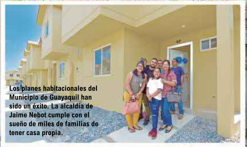
Los planes habitacionales del Municipio de Guayaquil han sido un éxito. La alcaldía de Jaime Nebot cumple con el sueño de miles de familias de tener casa propia.

El alcalde de Guayaquil, Jaime Nebot, entregó un nuevo grupo de viviendas en la etapa 11 de la urbanización Villa Bonita, ubicada en uno de los macrolotes del plan habitacional municipal Mi Lote, al norte de la ciudad, y felicitó a los nuevos propietarios por el sueño cumplido de contar con una casa propia. En el sitio, resaltó el esfuerzo de los propietarios que cristalizaron un sueño.