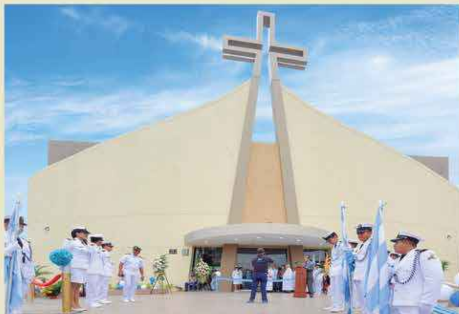
Entre las vastas obras entregadas en estos tiempos por la alcaldía de Nebot está la de los arreglos y adecentamiento general de la iglesia de San Felipe.

Paralelamente al trabajo en las peatonales, se está realizando al mantenimiento de los servicios de alcantarillado sanitario y de aguas lluvias con nuevas tuberías para después refaccionar las vías de acceso. Cabe indicar que las calles tendrán adoquines de colores con canales de aguas lluvias, nuevas aceras y bordillos, jardineras e iluminación que permitirá renovar la imagen para beneficio de sus moradores. Asimismo, dentro del trabajo municipal destacan los arreglos y adecentamiento general de la iglesia Madre Admirable de la ciudadela San Felipe, que fueron entregados por el jefe del Cabildo y por lo cual la comunidad católica expresó su alegría y su agradecimiento a la alcaldía por atenderlos oportunamente en su petición.