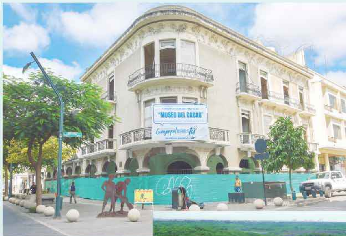
El Museo del Cacao será una realidad desde el próximo año, mientras tanto avanza satisfactoriamente su construcción.

En homenaje a la ciudad en su aniversario de Independencia, la Alcaldía resaltó 33 obras de re-