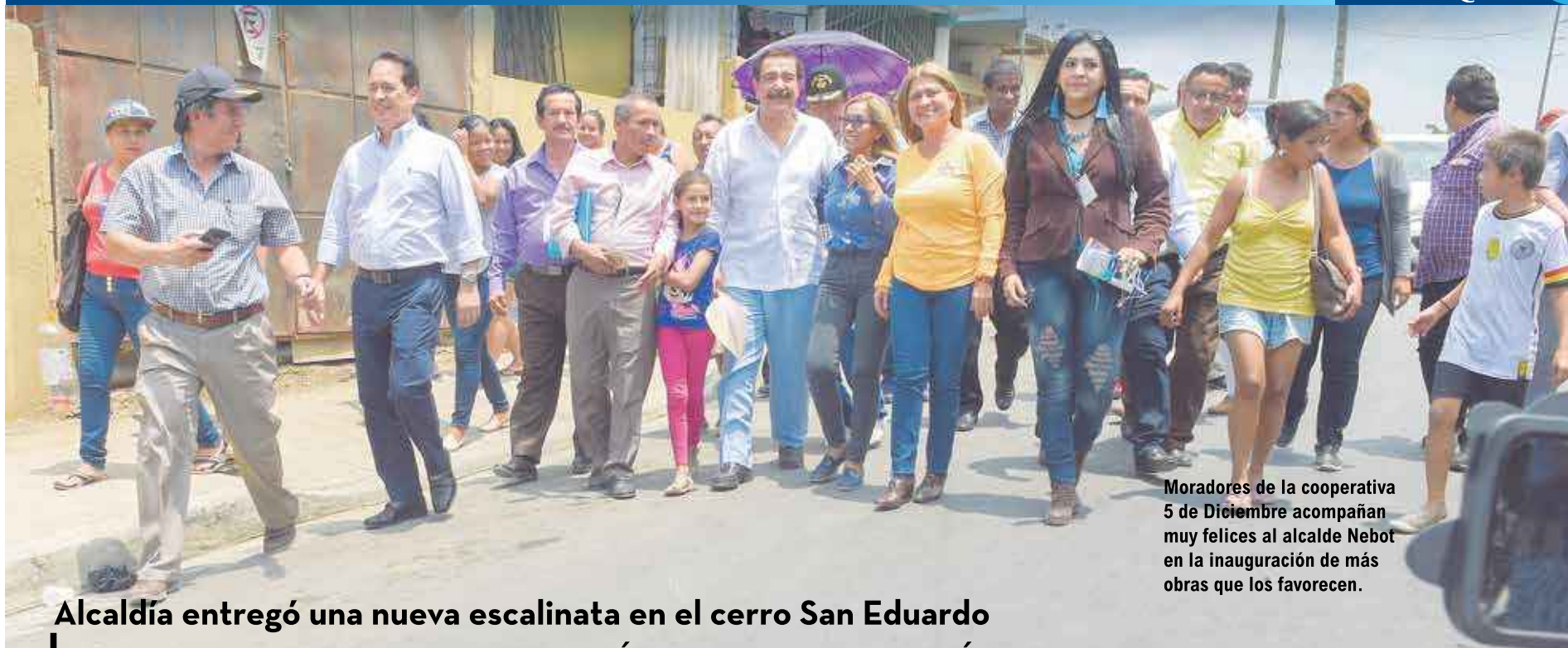
Moradores de la cooperativa 5 de Diciembre acompañan muy felices al alcalde Nebot en la inauguración de más obras que los favorecen.