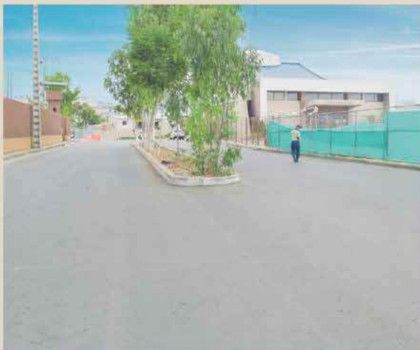
En el sector de El Fortín continúa con éxito la pavimentación de calles y los trabajos incluyen aceras, bordillos y más.