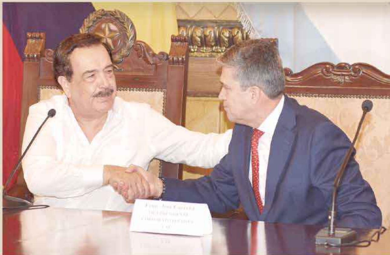
Jaime Nebot, alcalde de Guayaquil, y José Carrera, vicepresidente de la CAF, estrechan sus manos luego de la suscripción del préstamo entre esta entidad crediticia y el Municipio de Guayaquil.

“La garantía del Gobierno Nacional, en el caso del Municipio de Guayaquil es un requisito formal. Jamás el Gobierno ha tenido que desembolsar un solo centavo de dólar para cumplir con obligaciones que correspondían y han sido canceladas por la Municipalidad”, explicó el Alcalde al tiempo de explicar que este préstamo se destinará a ejecutar