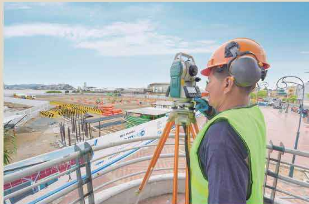
En una extensión de 15 mil metros cuadrados se realizan los trabajos para construir la Aerovía en Durán, en ese sitio se levantan las estructuras del sistema teleférico y se hincan los pilotes.