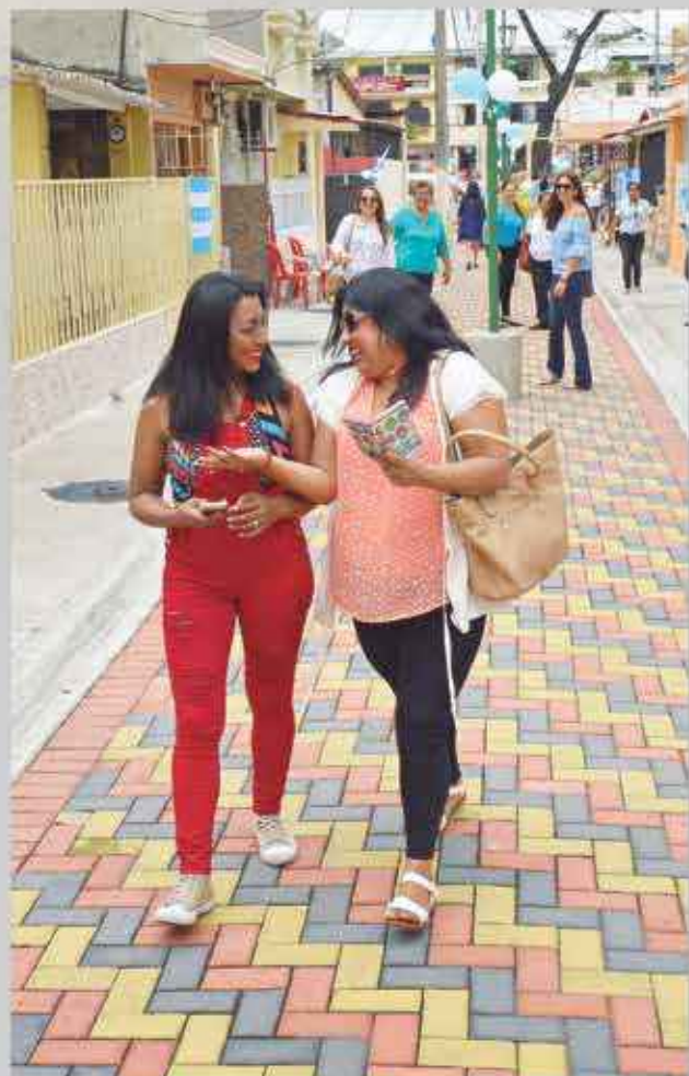
Esta peatonal de la Alborada luce un nuevo aspecto con los adoquines de colores.

Los moradores de la cooperativa 25 de Julio, ubicada en el cerro San Eduardo, al suroeste de la ciudad, agradecieron complacidos con la reciente obra entregada: una escalinata de hormigón que permite el desplazamiento con total comodidad hacia el ingreso de sus viviendas. El alcalde Jaime Nebot entregó la obra. La escalera se encuentra entre las manzanas 631, 632 y 633. Cuenta con barandas de tubo galvanizado, se reforzaron las barras y se complementa con nuevos postes metálicos de alumbrado público, con lámparas de sodio y tendido aéreo de cables. El jefe del Ayuntamiento recordó que en esos terrenos al inicio de su primera administración funcionaba un botadero abierto de basura que fue sellado técnicamente para después construir la Ciudad Deportiva Carlos Pérez Perasso, moderno escenario con canchas de fútbol, que es un semillero en el cual se enseña este deporte a niños y adolescentes.