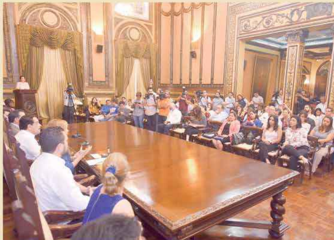
Con voto unánime se aprobó la Ordenanza que establece sobre la producción y comercialización de plásticos de un solo uso.

En plazos comprendidos entre 6 y 36 meses, los fabricantes de los productos deberán implementar las acciones necesarias para obtener el material reciclado conforme a las metas establecidas de forma individual, la carencia temporal de materia prima reciclada para fabricar el 100% de la producción de fundas plásticas con el 70% de material reciclado, el Municipio de Guayaquil, a través de su Dirección de Ambiente, podrá otorgar la dispensa temporal mientras dure la escasez. De esta forma, Guayaquil se constituye en el primer cantón del país que otorgará incentivos tributarios y honoríficos a las empresas e industrias que se ajusten a la normativa. Además se fomentará la cultura del reciclaje. También se aplicarán sanciones para quienes no acojan lo que la Ley dispone.