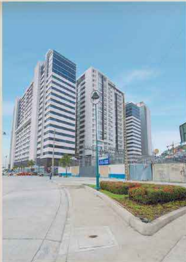
La pavimentación también llegó, como a todos los sitios de la ciudad, a Puerto Santa Ana, un sector que sigue progresando.

Mientras, a buen ritmo y dentro del cronograma, continúan también los trabajos de la Aerovía. Recientemente los alcaldes de Guayaquil, Jaime Nebot y de Durán, Alexandra Arce, recorrieron el predio expropiado de una extensión de 15 mil metros cuadrados, donde se construye la estación de la Aerovía en Durán. Ahí los trabajadores del consorcio Sofratesa y POMA levantan las estructuras del sistema teleférico y se hincan los pilotes del proyecto que alcanza un 50% de su ejecución. Los obreros realizan la fundición de replantillos y la colocación de la armadura de acero de esta estación donde se levantará el edificio principal, el garaje de las cabinas y la estructura del sistema teleférico.