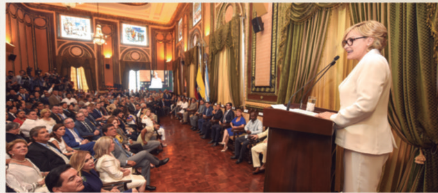
Cynthia Viteri asumió el mando de la administración municipal, para el período 2019-2023, en medio del aplauso y el júbilo del público presente en el Salón de la Ciudad del Palacio Municipal.