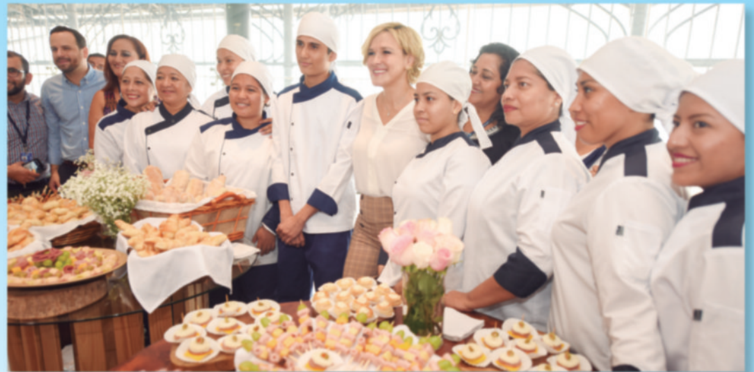
La alcaldesa de Guayaquil recorrió con mucha satisfacción los stands que mostraban el desarrollo y trabajo de quienes se capacitan gratuitamente en los Centros de Artes y Oficios del Municipio.

La primera autoridad del cantón, recorrió todos los stands de los 707 alumnos que se educan en los centros municipales de Artes y Oficios, que ofrecen carreras artesanales como: confección y bordado, belleza, gastronomía y mecánica, y luego de tres años obtienen certificaciones artesanales.