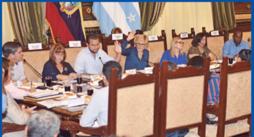
La nueva empresa municipal fomentará el empleo y el emprendimiento y ya se aprobó la Ordenanza respectiva.

En su acta constitutiva, la Empresa Pública Municipal para la Gestión de la Innovación y la Competitividad tiene como objeto "promover el desarrollo económico de la ciudad hacia actividades intensivas en ciencia, tecnología e innovación, fomentando el empleo, promoviendo el emprendimiento, dando apoyo a las personas, instituciones y empresas de forma incluyente y sostenida, en orden a lograr la competitividad de la ciudad".