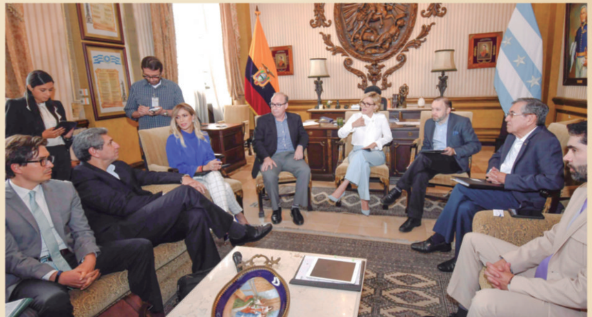
Representantes de los bancos de Desarrollo del Ecuador (BDE) e Interamericano de Desarrollo (BID) mantuvieron una positiva reunión con la primera autoridad del cantón.