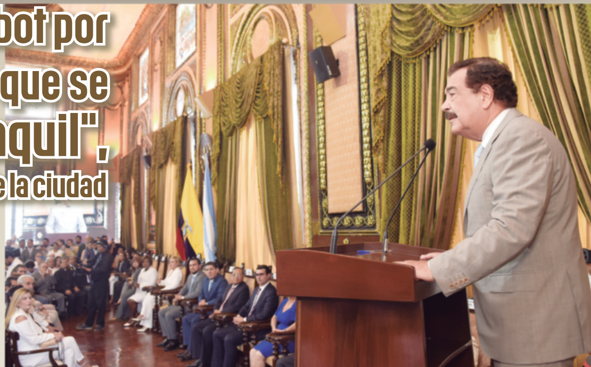
Jaime Nebot, alcalde saliente, enfatizó que no es día de despedidas, porque ni se despide, ni se va, “aquí estoy y aquí estaré, nunca dejaré de servirlos”.

De su lado, la flamante Alcaldesa le respondió que era una ocasión histórica y propicia para “darle el más fraterno abrazo en nombre de los guayaquileños, señor Alcalde, para decirle gracias por los 19 años en los que se batió por Guayaquil, entre la calle y este Salón; con los brazos abiertos o el puño en alto, sosteniendo la bandera, bandera que es un grito, un llamado, una causa, una razón, para decir orgullosos: somos guayaquileños” y remató anotando que “contamos con usted en todo momento y cuenta con nosotros ahora, a donde vaya. Ahí estaremos, para que la transformación de Guayaquil, la viva la nación”.